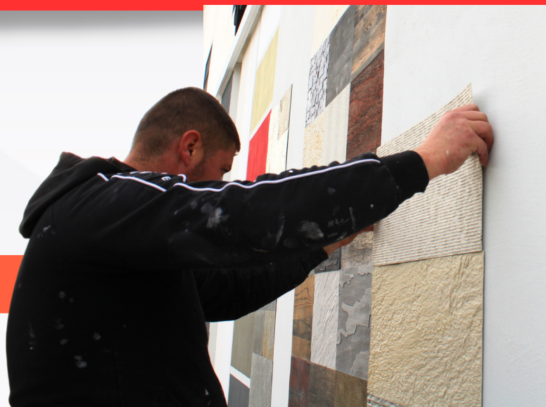
INSTALACIÓN DE DIFERENTES TIPOLOGÍAS DE ACABADOS